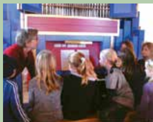
Organisten viser orglet for minikonfirmanderne.