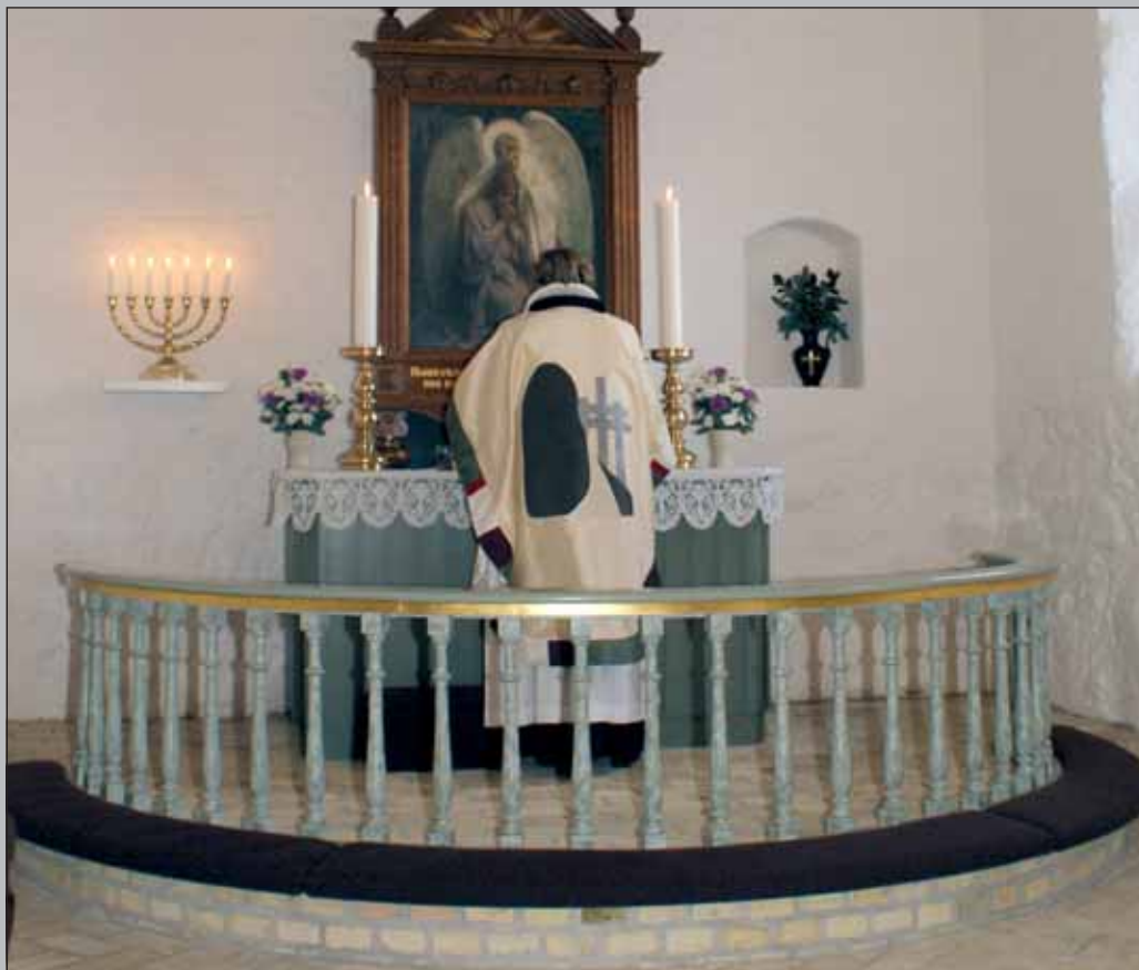
Ny messehagel i Gundersted Kirke