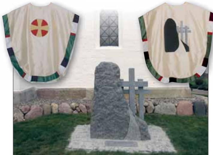
Sådan blev det: Stensulpturen (rygmotiv), korset (foran) og kirkeårets liturgiske farver (kanten rundt) er på den fine nye messehagel i Gundersted.